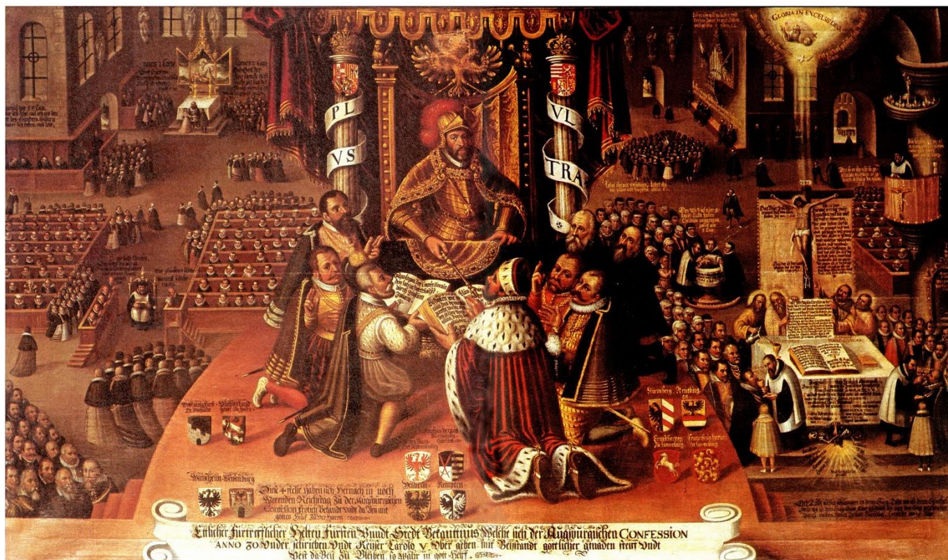
Augsburgska bekännelsen presenteras för kejsar Karl V den 25 Juni 1530. Tavlans finns i Pfarrkirche St Georg i Eisenach.